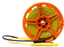
Prüfleitung 50 m auf Spule (Bananenstecker, abgeschirmt) gelb