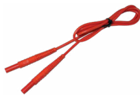
Prüfleitung 1,2 m (Bananenstecker) rot