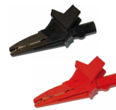
Krokodilklemme 1 kV 20 A schwarz / rot