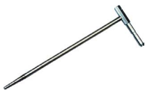
4x Sonde 30 cm