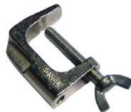
Kl. Schraubstock (Bananenstecker)