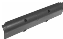
Akkupaket 4,8 V 4,2 Ah