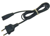
Stromversorgungskabel 230 V (IEC C7)