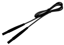
Prüfleitung 2,2 m (Bananenstecker) schwarz